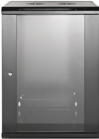
Shown: Model with 450 mm (17.7 in.) Depth