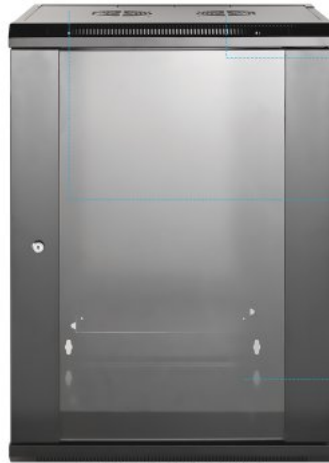
Shown: Model with 450 mm (17.7 in.) Depth