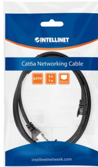
Model Shown: #318761