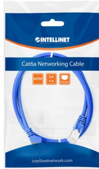
Model Shown: #741477